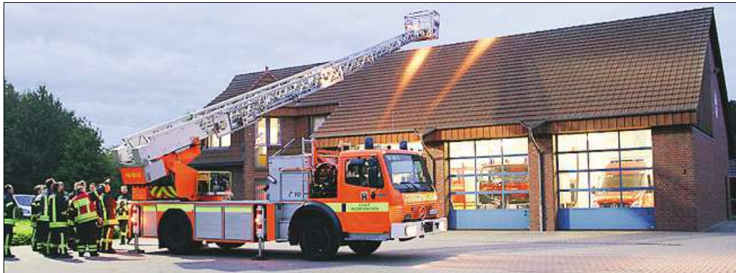
Ausgefahren vor dem Dötlinger Feuerwehrhaus: die Drehleiter der Freiwilligen Feuerwehr Wildeshausen im Übungseinsatz.

Lutz Ertelt, Zugführer in der Wildeshauser Wehr, ging im Dötlinger Feuerwehrhaus zunächst theoretisch auf die Besonderheiten der fahrbaren Leiter ein. Er verdeutlichte, auf welche Faktoren bereits während der Anfahrt der Drehleiter durch die Einsatzkräfte geachtet werden könne.