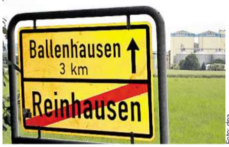
Reinhausen? Ballenhausen? Dieses Schild stand am Ortseingang von Stockhausen.

GÖTTINGEN. In mehreren Orten in Südniedersachsen haben Unbekannte in der Nacht zu Dienstag die Eingangsschilder entfernt und dann in anderen Orten wieder angebracht. Die Täter seien handwerklich völlig korrekt vorgegangen, sagte eine Polizeisprecherin. „Sie haben alle Schilder ordentlich ab- und wieder angeschraubt. Zerstört wurde nichts.“ Betroffen waren die Dörfer Klein Schneen, Stockhausen, Oberjesa, Ballenhausen, Reinhausen und Harste im Landkreis Göttingen, die Stadt Göttingen sowie die Dörfer Paresen und Nörten-Hardenberg im Landkreis Northeim. Die Straßenmeisterei hatte die vertauschten Schilder nach Angaben der Polizeisprecherin bis zum Mittag wieder an die richtigen Stellen gebracht. Sachschaden sei nicht entstanden. Der Scherz scheint sich wachsender Beliebtheit zu erfreuen: Vor wenigen Wochen hatten Unbekannte bereits in der Region Hannover Ortsschilder vertauscht.