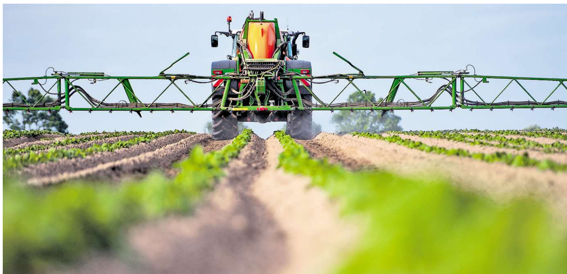
„Es gibt akuten Handlungsbedarf“: Besonders in Anbaubereichen von Raps, Rüben und Mais wurden Pflanzenschutzmittel im Grundwasser gefunden.

GÖTTINGEN. In mehreren Orten in Südniedersachsen haben Unbekannte in der Nacht zu Dienstag die Eingangsschilder entfernt und dann in anderen Orten wieder angebracht. Die Täter seien handwerklich völlig korrekt vorgegangen, sagte eine Polizeisprecherin. „Sie haben alle Schilder ordentlich ab- und wieder angeschraubt. Zerstört wurde nichts.“ Betroffen waren die Dörfer Klein Schneen, Stockhausen, Oberjesa, Ballenhausen, Reinhausen und Harste im Landkreis Göttingen, die Stadt Göttingen sowie die Dörfer Paresen und Nörten-Hardenberg im Landkreis Northeim. Die Straßenmeisterei hatte die vertauschten Schilder nach Angaben der Polizeisprecherin bis zum Mittag wieder an die richtigen Stellen gebracht. Sachschaden sei nicht entstanden. Der Scherz scheint sich wachsender Beliebtheit zu erfreuen: Vor wenigen Wochen hatten Unbekannte bereits in der Region Hannover Ortsschilder vertauscht.