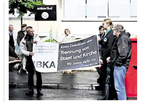
„Trennung von Staat und Kirche“: Protest gegen den Loccumer Vertrag.